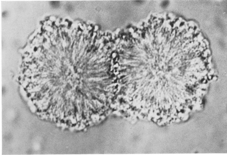
FIGURE 1 Appareil mitotique isolé de l'oeuf de Paracentrotus lividus au stade métaphase. \times 1350 .